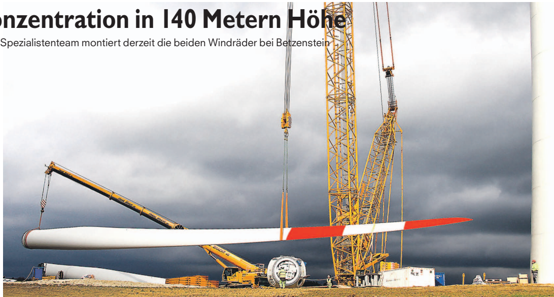
Mit einem 158 Meter hohen Aufstellkran werden die Teile der Windräder montiert – hier eines der Rotorblätter.