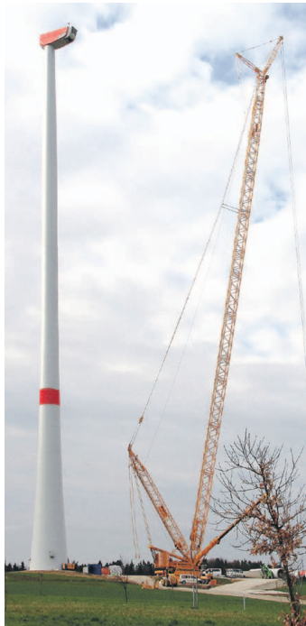
Für die Montage müssen Windgeschwindigkeiten von nicht mehr als sechs Metern in der Stunde herrschen.

benhöhe auf 141 Metern eine große Windangriffsfläche. Wenn bereits am Boden ein Luftzug zu spüren ist, dann ist dieser an der Kranspitze meist doppelt so stark.“