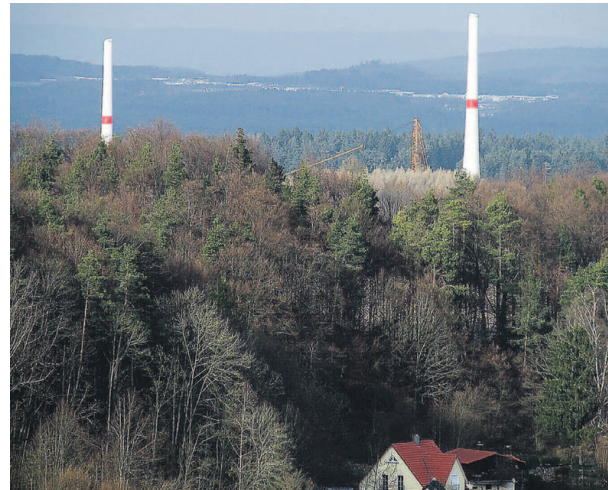
Die Windräder wurden vor Inkrafttreten der 10H-Regelung genehmigt. Sie stehen deshalb vergleichsweise nahe an der Bebauung.